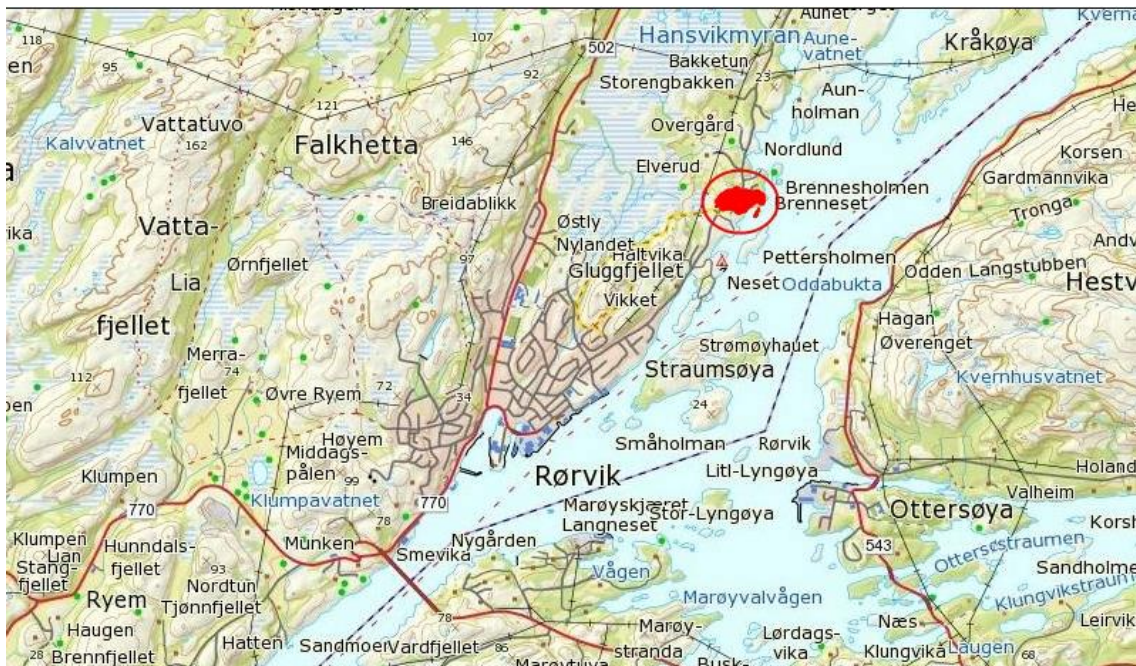
Bilde 2: Kartutsnitt som viser beliggenheten i området